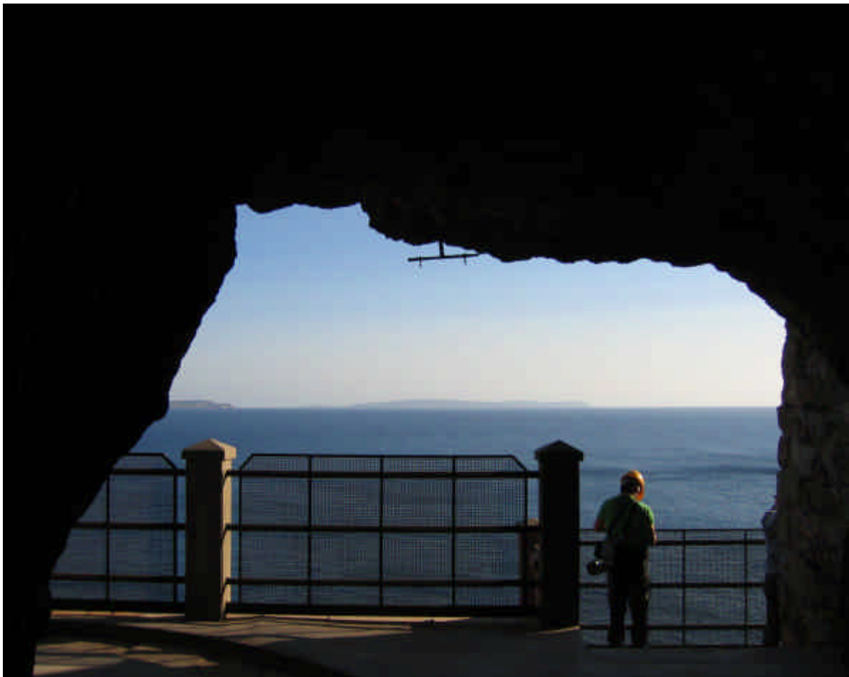
Foto 5 – uno scorcio della miniera di Masua, direttamente sul mare