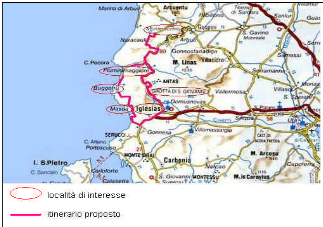
Fig.3 – Itinerario nell'Iglesiente. Scala 1:500.000

Le dune di Piscinas, località definita il Sahara italiano. Bello goderselo con una gita a cavallo.