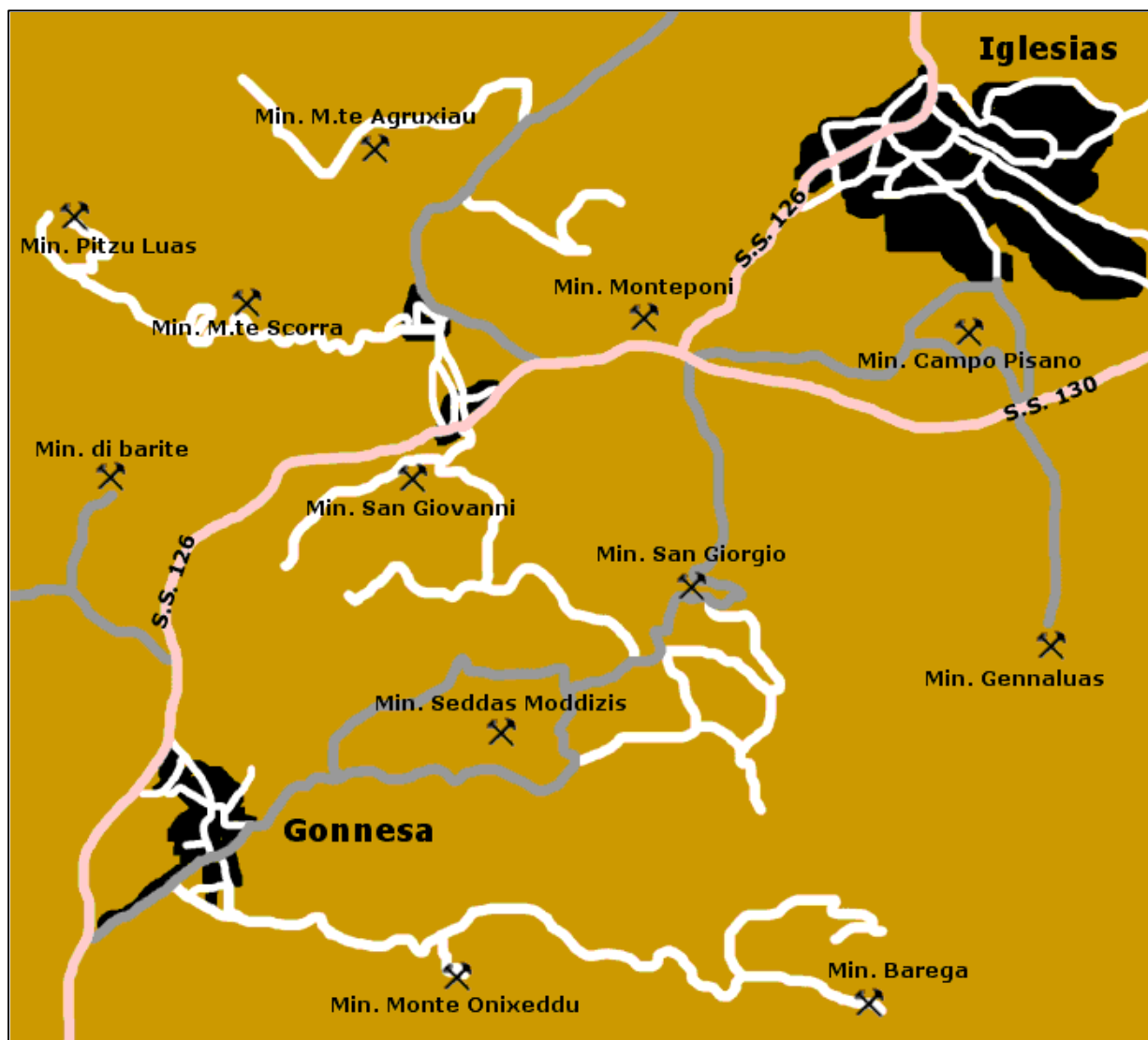
Fig.4- La ricchezza del territorio di Iglesias in fatto di miniere