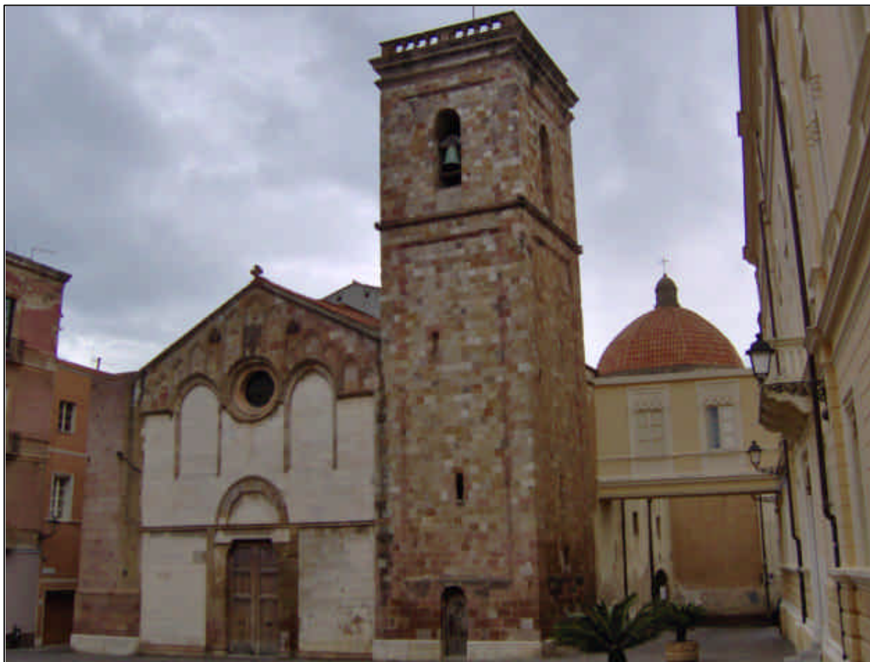
Foto 3 – La quattrecentesca cattedrale di santa Chiara, a Iglesias

TRILOBITI: organismi marini molto primitivi, tra i primi esseri viventi di grandi dimensioni apparsi sulla Terra, vissuti esclusivamente durante l'era Paleozoica, circa tra 570 e 230 milioni di anni fa. Costituiscono pertanto un importante "fossile guida", in quanto il rinvenimento di tracce di trilobiti in un giacimento permette di attribuirlo senza ombra di dubbio al Paleozoico.